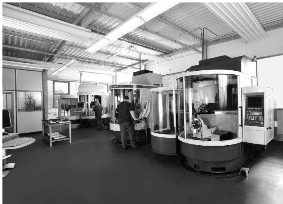
Hier entsteht Schärfe: moderne Maschinen, erfahrene Mitarbeiter.

Im Bereich der Fräser- und Bohrer-Wiederaufbereitung ist man bei Wunschmann bestrebt, jedem Kun-