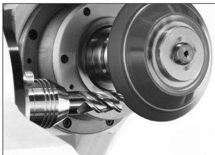
Nachschärfen rechnet sich: VHM-Fräser auf der Maschine.

Streng genommen ist die Werkzeugaufbereitung übrigens die Keimzelle